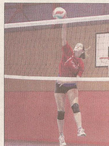
El Norvoley en acción.

lejos, la próxima semana se desplazarán a Gijón y Valladolid para disputar varios encuentros con sus equipos sénior, juvenil y cadete, para completar la pretemporada.